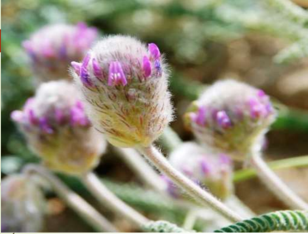
Ayaş gümüü ( Astragalus densifolius subsp. ayasniensis )