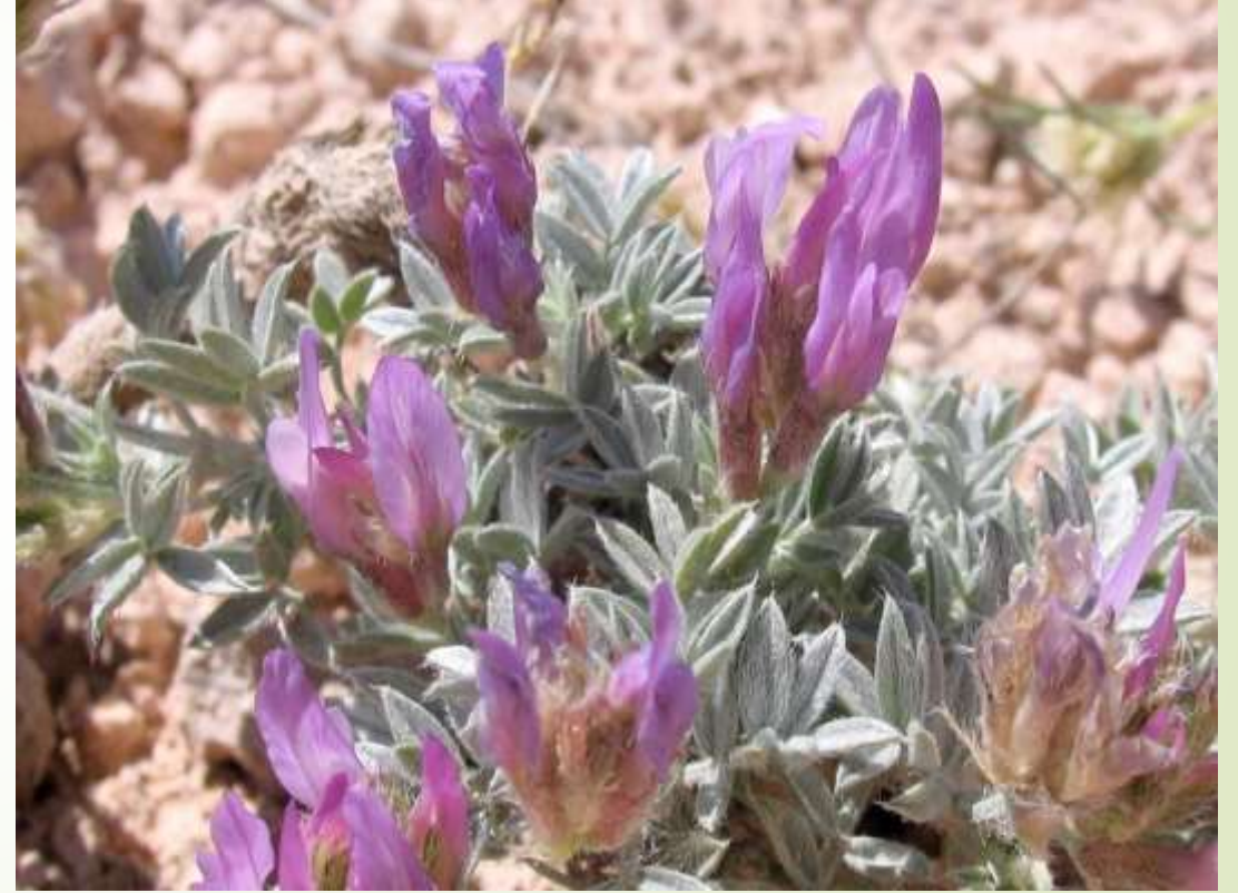
Koçak geveni ( Astragalus kochakii )