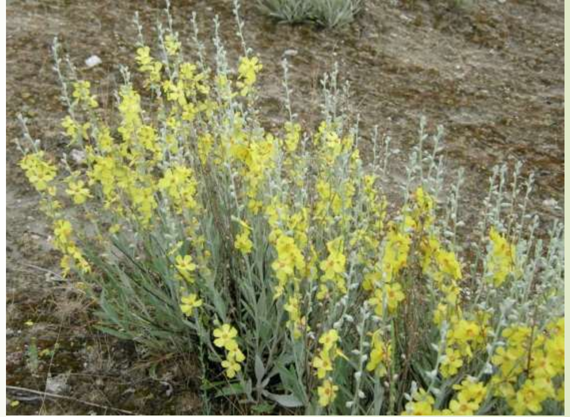
Mermer siğirkuyruğu ( Verbascum gypsicola )