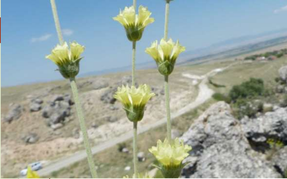
Kırçayı ( Sideritis galatica )