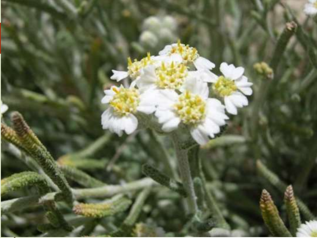
Şah civanperçemi ( Achillea ketenoglui )