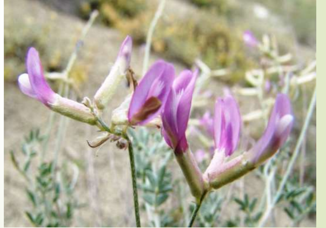
Beypazarı geveni ( Astragalus beypazaricus )