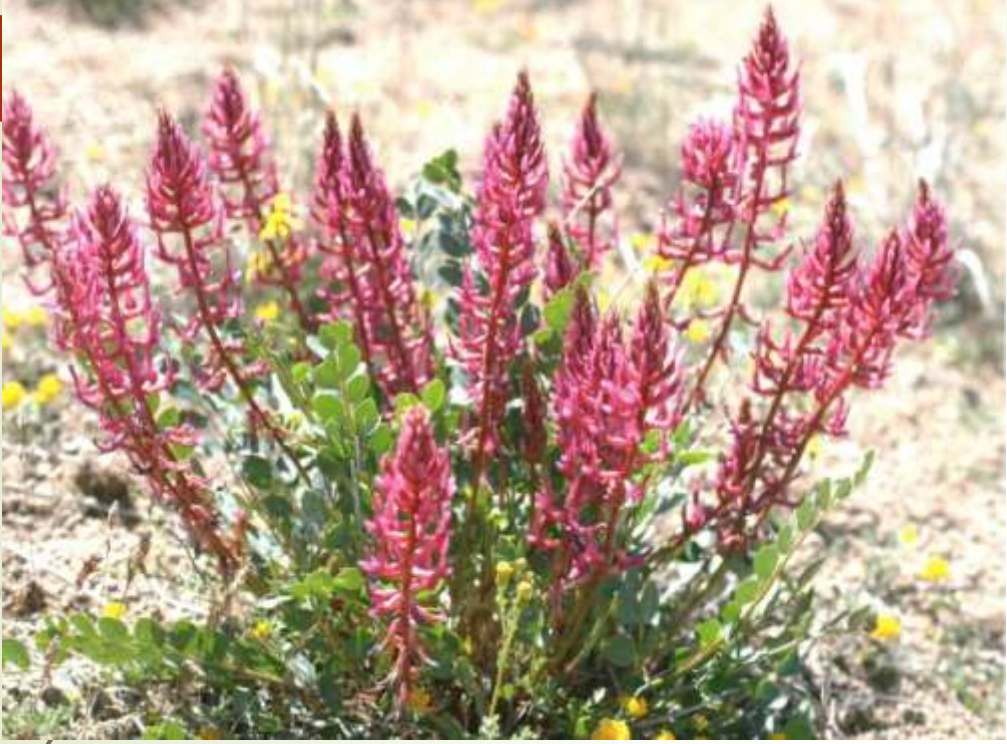
➤ Gürsöğüt geveni (Astragalus yildirimlii)