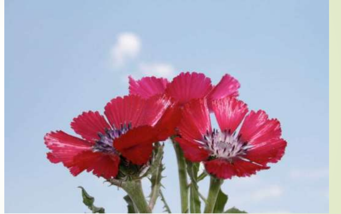
Sevgi çiçeği (Centaurea tchihathefii)