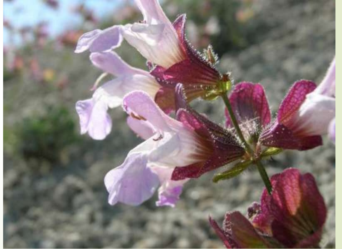
Ay şalbanı ( Salvia aytachii )