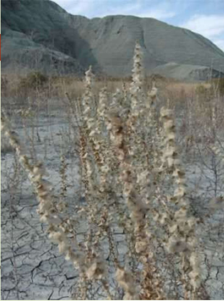
➔ Koca soda ( Salsola grandis )